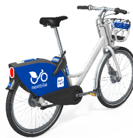
Das in Sempach eingesetzte nextbike mit elektronischem Rahmenschloss.