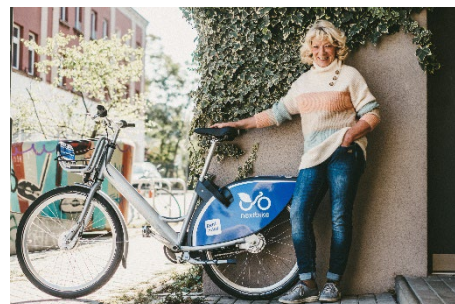
nextbike kann von der Bevölkerung für bis zu 30-minütige Fahrten kostenlos genutzt werden.

Alle Bilder finden Sie im Downloadbereich .